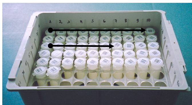
2. Attēls. Paraugu izkārtojuma shēma.